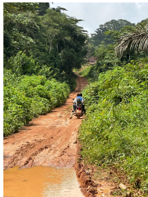
In foto: a sinistra la mappa del percorso, a destra la strada prima dell'avvio dei lavori.